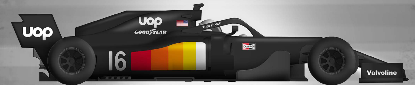
SHADOW DN5 (1975)

Combinando queste livree spettacolari con lo stato dell'arte dell'ingegneria e qualità per cui POLICAR e SLOT.IT sono rinomate, vi aspettano parecchie ore di adrenalina dalla comodità del vostro salotto, senza alcuna preoccupazione riguardo qualità o affidabilità.